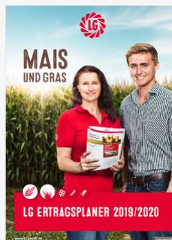
PDF meiner Sammlung hinzufügen

Hier können Sie den LG Ertragsplaner Mais und Gras als PDF PDF meiner Sammlung hinzufügen herunterladen. Wie gewohnt mit interaktiven Elementen (Augmented Reality) und reichlich Fachinfos.